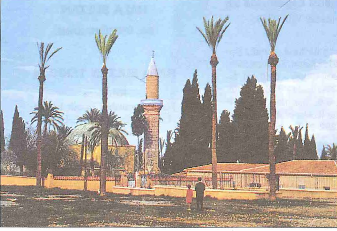
Hala Sultan Tekkesi – Larnaka / Güney Kıbrıs

lı bir kırma çatı örtmektedir. Yanlardan akantus yapraklı mermer pilastrların kuşattığı kapının sivri kemeri uçları volütlü bir kaval silme ile zenginleştirilmiştir. Kemerli taçlandırılan kitâbenin yanlarında, zincir kabartmalarına asılı iki madalyon içinde tuğralar dikkati çeker. Girişi takip eden avlu kuzey, batı ve güney yönlerinde tekke birimleriyle kuşatılmış, giriş ekseninin soluna (kuzey) şadırvan, sağına cami ile bunun arkasına türbe yerleştirilmiştir.